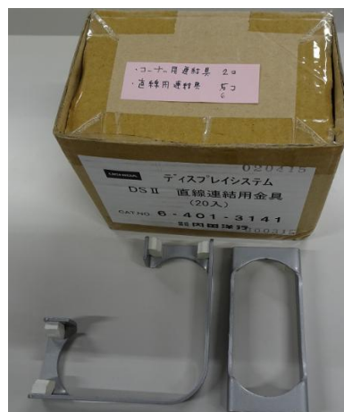
コーナー用2個、直線用6個