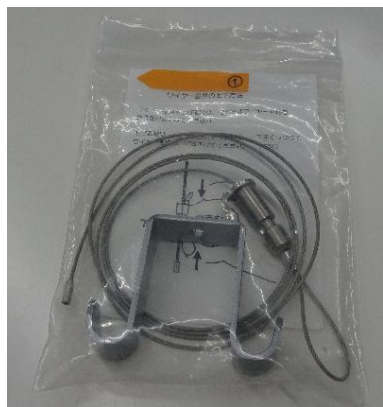
① ワイヤー（細）・フック 20 袋