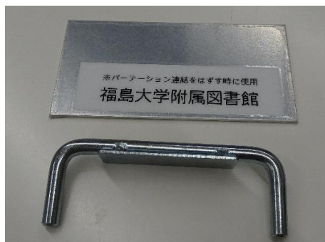
18個 (上の板は取り外し用)