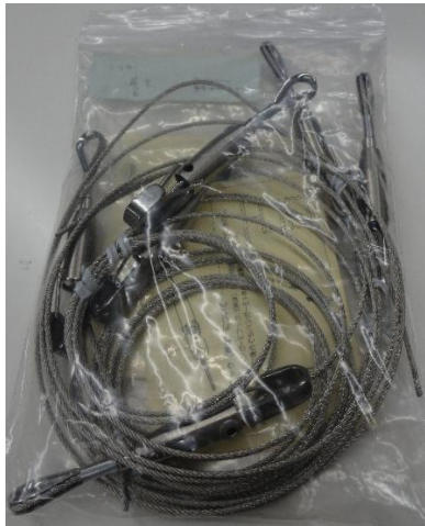
⑦ ワイヤー (太) 6本