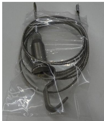
④ ワイヤー（太）1 本