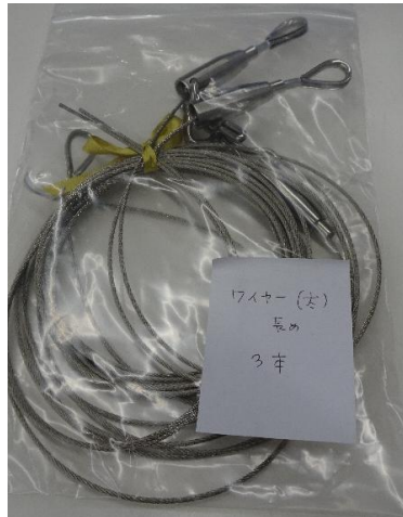
⑧ ワイヤー (太・長) 3本