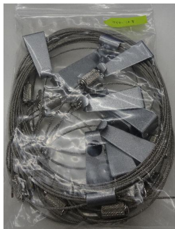
⑤ ワイヤー（太）フック 10 本