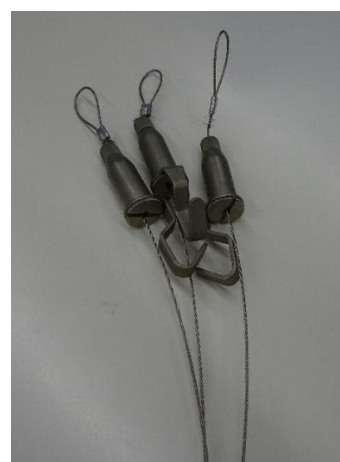
③ ワイヤー（細）3 本