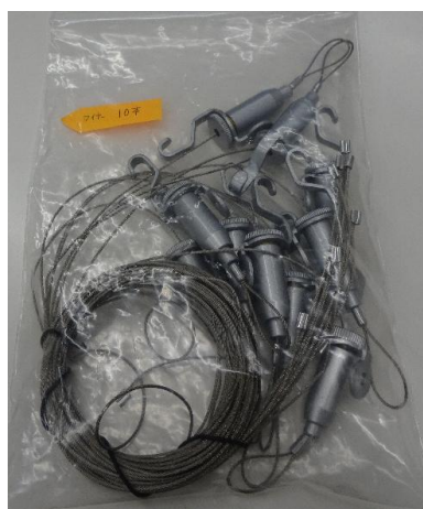
② ワイヤー（細）10 本