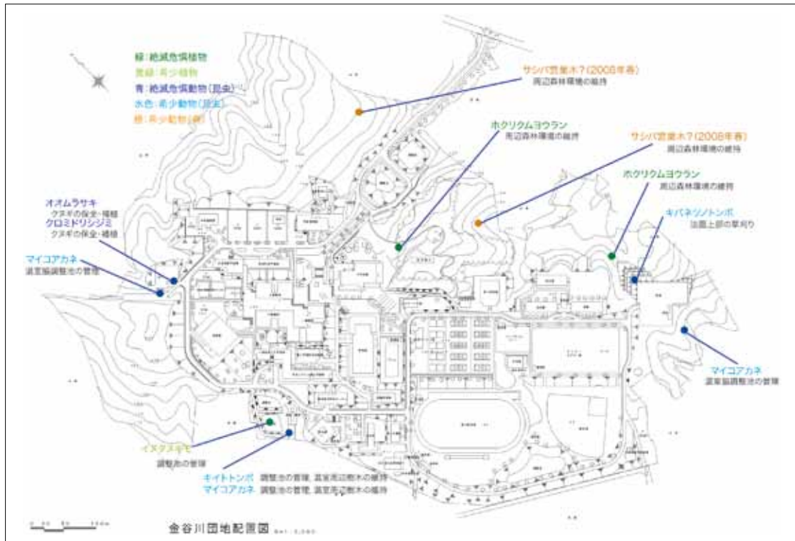
図2. 福島大学金谷川キャンパス絶滅危惧生物・希少生物位置図。

2009年2月に福島大学施設整備・環境対策委員会に提出したものを一部改訂してある。また、公開すると保全に支障のあると考えられる絶滅危惧生物・希少生物の確認場所を削除してある。