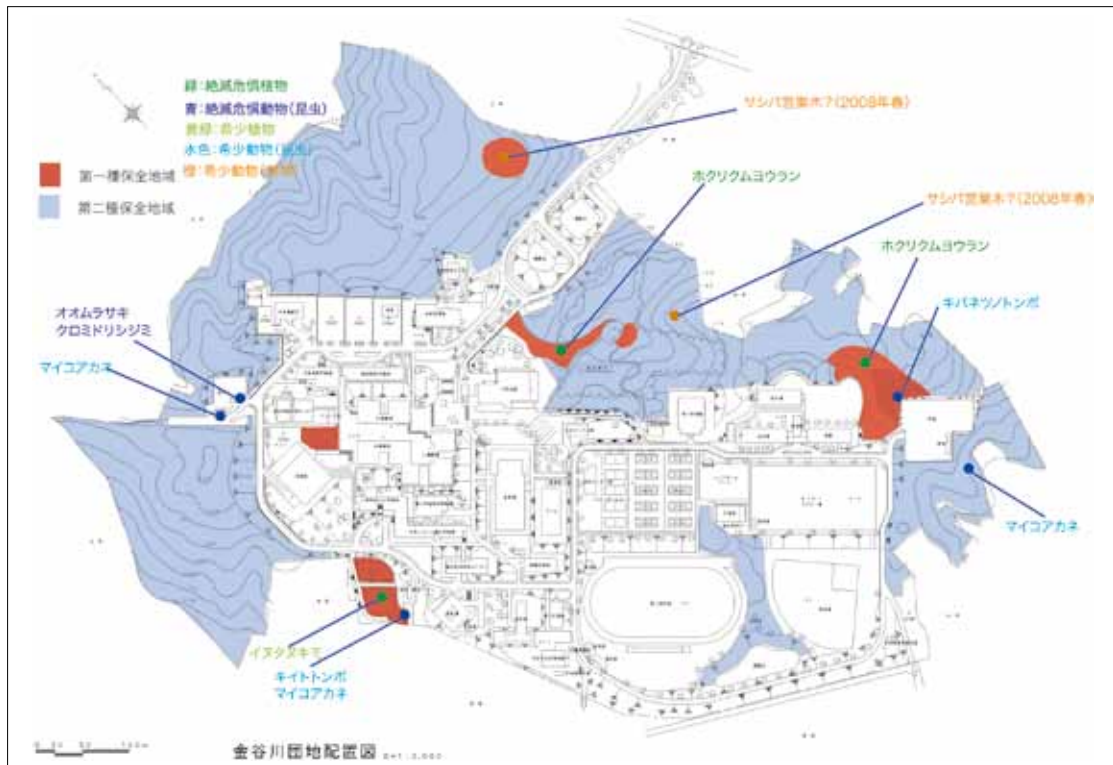
図3. 福島大学金谷川キャンパス第一種保全地域、第二種保全地域案。

2009年2月に福島大学施設整備・環境対策委員会に提出したものを一部改訂してある。また、公開すると保全に支障のあると考えられる絶滅危惧生物・希少生物の確認場所を削除してある。